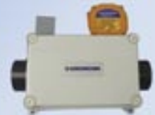
Controllo dispositivo di campionamento per Environmental Sampling Unit Crowcon