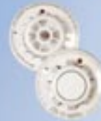
Fino a 20 rivelatori incendio/calore per zona