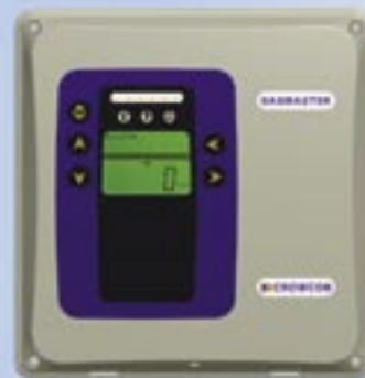
Pannello di controllo Gasmaster 1 per 1 rivelatore gas, zona antiincendio o Environmental Sampling Unit (Unità rilevamento ambientale).