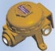
Rivelatori gas standard